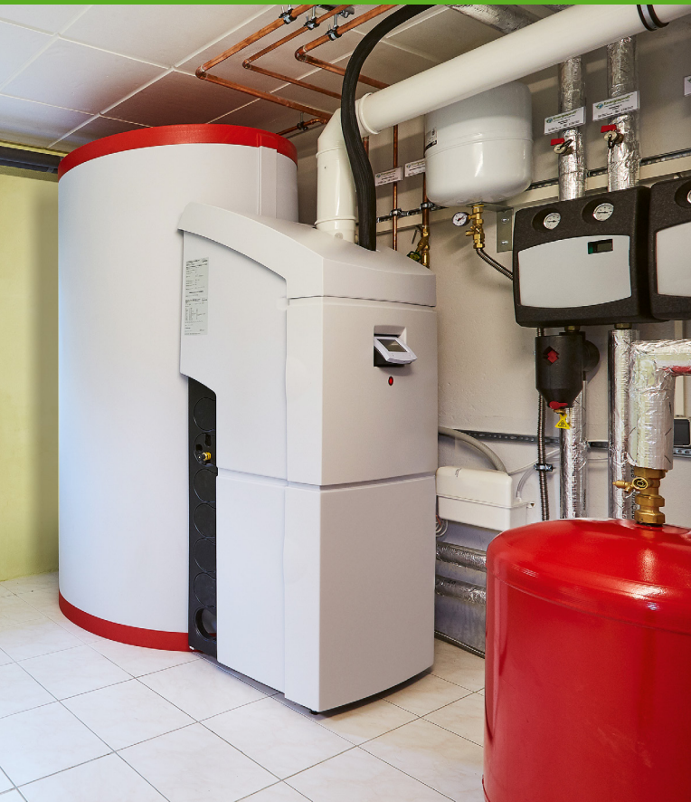
Gasheizungen lassen sich auch mit klimaneutralem Gas betreiben – heute schon mit Bio-Erdgas. Im Bild: eine moderne Gas-Brennwertheizung mit integriertem Warmwasserspeicher für die Solarthermie-Anlage

Auf dem Weg zur Klimaneutralität in Deutschland und Europa wird der Anteil von klimaneutralem Gas in den nächsten Jahren also deutlich zunehmen. Damit leistet die deutsche Gaswirtschaft ihren Beitrag, die Klimaziele einzuhalten. Die Zukunft ist klimaneutral, und das betrifft dann auch das Heizen und viele weitere Gasanwendungen.