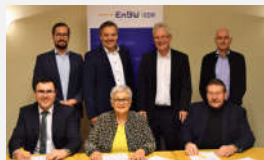
Syrgenstein, Zöschingen, Bachhagel*